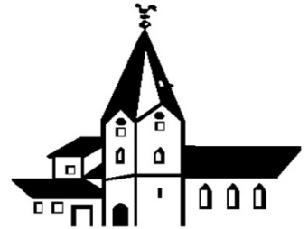
St. Petrus in Ketten Weiskirchen

pfarrbuero@pfarrgruppe-hainhausen-weiskirchen.de www.pfarrgruppe-hainhausen-weiskirchen.de