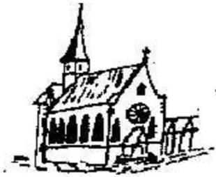
St. Rochus Hainhausen