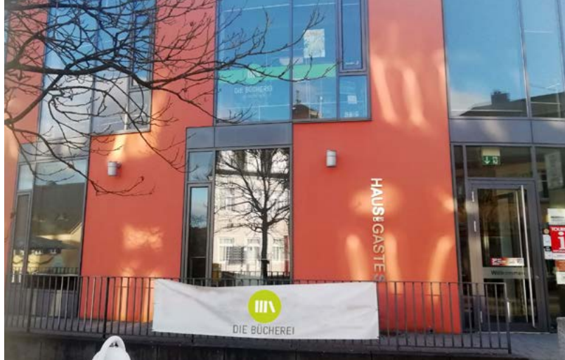
KÖB Don Bosco im Haus des Gastes Weiskirchen, © Fachstelle Trier