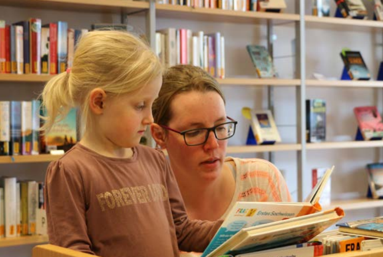
KÖB St. Briccus Wurmlingen