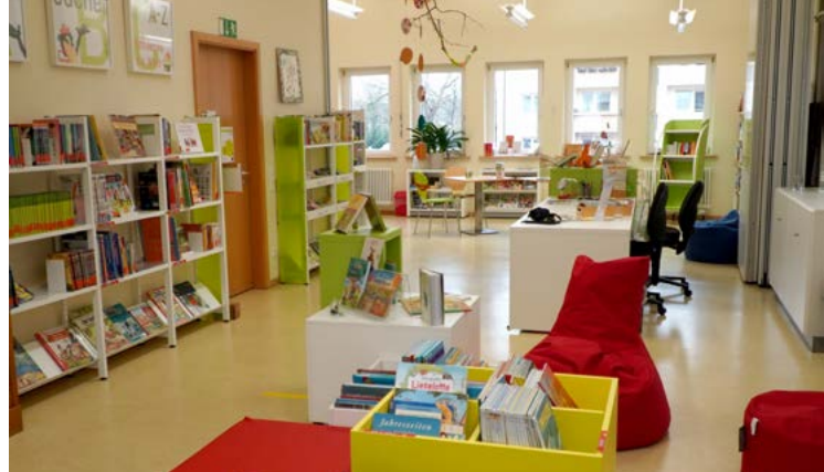
KÖB St. Elisabeth Karlsruhe