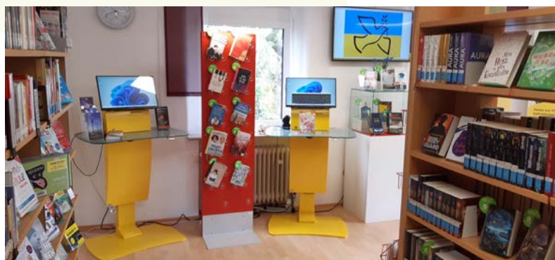
KÖB St. Jakobus Haigerloch-Owingen