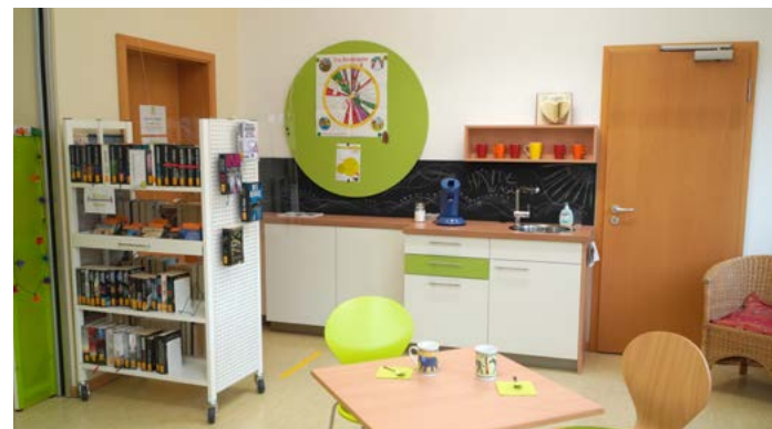
KöB St. Elisabeth Karlsruhe

Die Rahmenempfehlungen beschreiben das Anforderungsprofil einer zeitgemäßen Katholischen Öffentlichen Bücherei. Alle Aspekte der Büchereiarbeit – vom pastoralen Auftrag über die räumliche und technische Ausstattung bis hin zu einem modernen zeitgemäßen Auftritt – sind in den Blick genommen. Die Empfehlungen verstehen sich dabei in erster Linie als Hilfestellung. In 18 Kriterien steht den Trägern wie den ehrenamtlichen Büchereiteams eine zukunftsweisende Orientierung bereit.