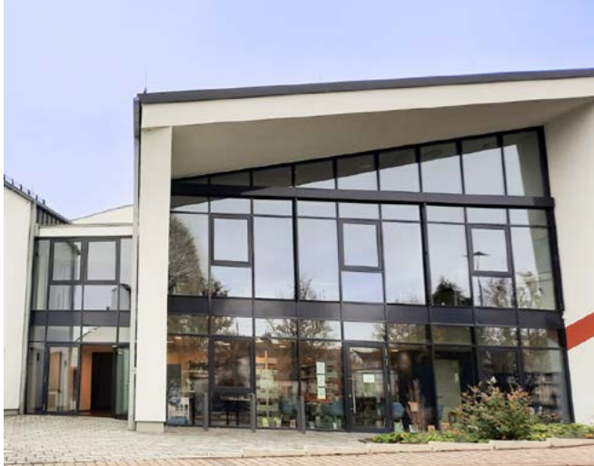
KÖB St. Lambertus Halsenbach im Bürgerzentrum