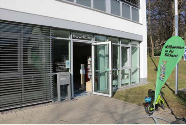
KÖB St. Briceus Wurmlingen