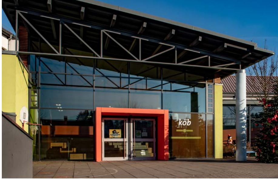
KÖB Mörlenbach, Bücherei im Schulzentrum

Katholische Öffentliche Büchereien müssen sich mit den gesellschaftlichen wie kirchlichen Veränderungen auseinandersetzen, um auch für die Zukunft gut aufgestellt zu sein. Die Rahmenempfehlungen zu Standards*, die der Borromäusverein entwickelt hat, leisten hier gute Unterstützung.