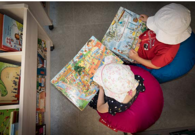
Lesende Kinder, KÖB St. Martin Freiburg-Hochdorf

„Ich gehe schon seit meiner frühen Kindheit zur Ausleihe.“