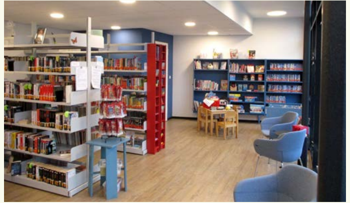
KÖB St. Lambertus Halsenbach im Bürgerzentrum