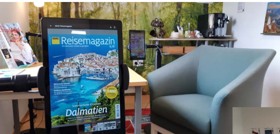
KÖB St. Jakobus Haigerloch-Owingen, © Bernd Liener