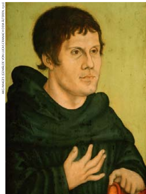
GEMÄLDE VON LUCAS CRANACH DEM ÄLTEREN, 1529

Das Problem des Übels lässt sich weiter abschwächen, wenn man die Allmachtsvorstellung modifiziert, etwa durch die Annahme, dass Gott im Entschluss zur Schöpfung seine Allmacht selbst begrenzt hat. Diese Variante wird sogar