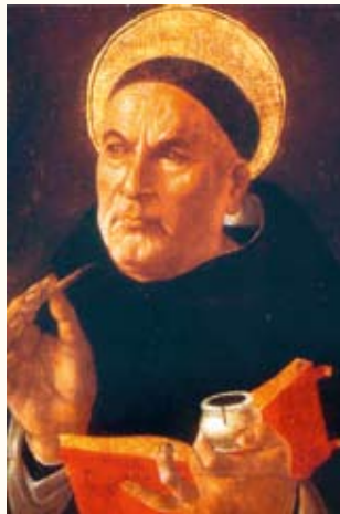
GEMÄLDE: SANDRO BOTTICELLI/ZUCCHERBERN, 1487