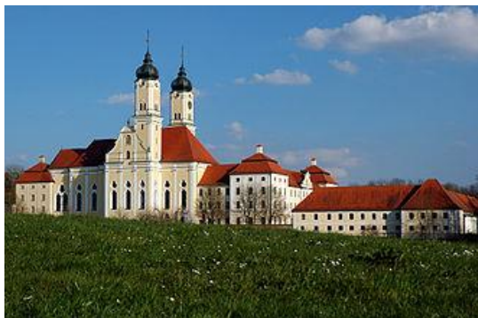
Prämonstratenser-Chorherrenstift Kloster Roggenburg