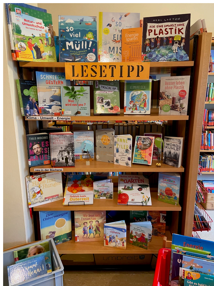
Themenregal Klima-Umwelt-Energie und Frühling - Ostern

Die Grundschule Weinheim war mit allen 6 Klassen monatlich zur Ausleihe in der Bücherei. Die Kita Weinheim war mehrmals in der Bücherei oder wurde von uns besucht. Es wurde vorgelesen und eine Bücherauswahl hinggebracht. Wechselnde Themenregale zeigten das aktuelle Angebot der Bücherei: Wir starteten im Januar mit Klima - Umwelt - Energie und ergänzten im März mit Medien zu Frühling - Ostern dabei hatten wir eigene Medien mit Büchern aus der Bücherei am Dom in Mainz ergänzt.