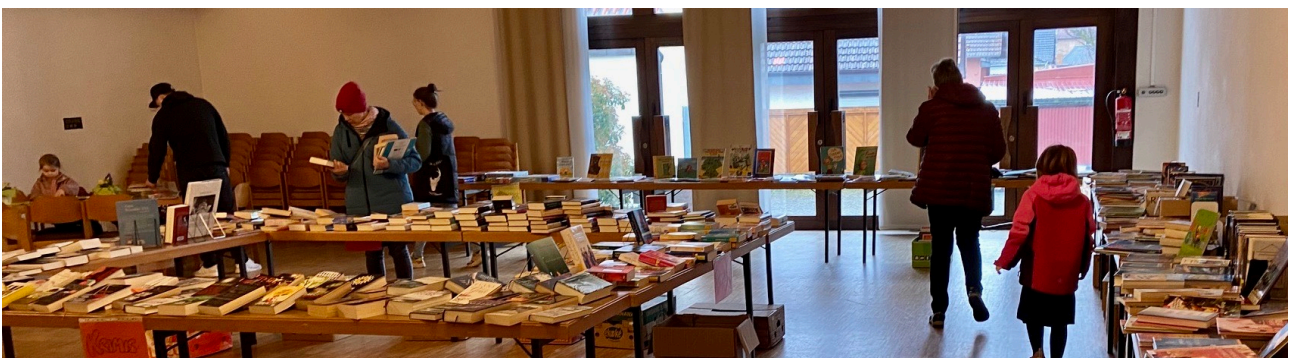
Bücherflohmarkt März 2023

Preissteigerungen : Medien, Material .. alles kostete fast 20% mehr. Im Gegensatz zu Lebensmitteln und Energiekosten wird diese Preissteigerung nicht nach unten korrigiert werden.