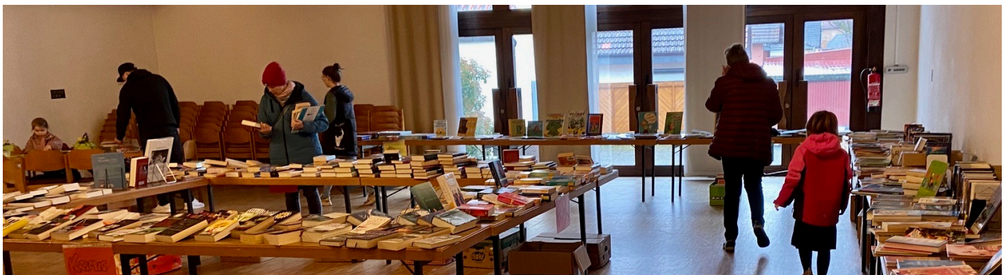
Bücherflohmarkt im März 2023

Aus den Vorjahren sind noch Rücklagen vorhanden.