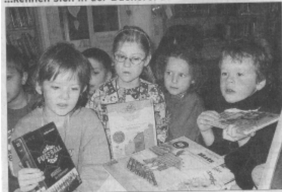
Aufmerksame Bibfit-Kinder wissen, wo sie Bücher bekommen.

Ganz stolz trugen in den letzten Wochen die Erbacher Kindergartenkinder einen Rucksack, auf dem „Ich bin Bibfit“ stand. Sie kamen gerade mit ihrer Kindergartengruppe aus der Katholischen Öffentlichen Bücherei St. Sophia. Bei ihrem Besuch lernten die Kinder aussuchen und ausleihen, vorlesen und zuhören, erzählen und wissen und natürlich was in der Bücherei an welcher Stelle zu finden ist. Zum Abschluss erhielten sie den Rucksack und den „Bibliotheksführerschein“, mit dem bestätigt wird, daß sie die Bücherei kennen gelernt haben und sie selbständig nutzen können.