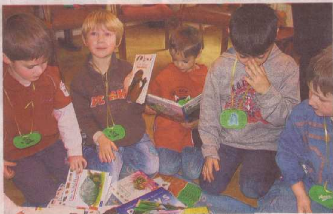
120 DEN „BIBLIOTHEKSFÜHRERSCHEIN“ erhielten 120 Erbacher Vorschulkinder nach ihren Besuchen in der katholischen Bücherei St. Sophia. (SW)