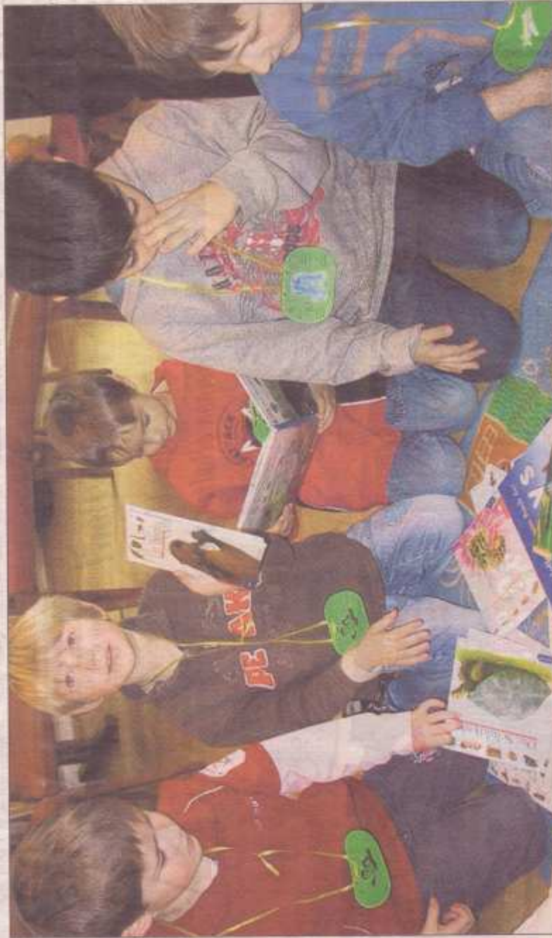
Spaß am Stöbern in der Katholischen Öffentlichen Bücherei St. Sophia in Erbach haben diese Vorschulkinder.