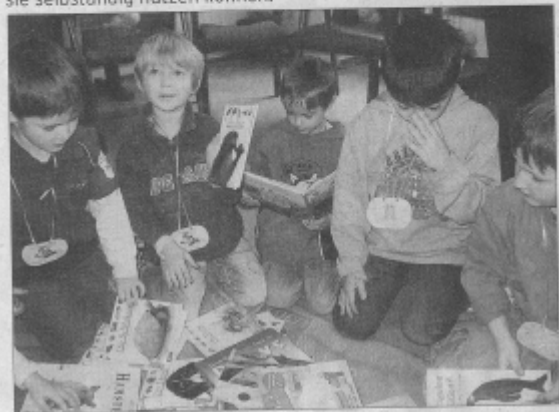
Bibfit-Kinder in Aktion: zielsicher in der großen Auswahl.

Ganz stolz trugen in den letzten Wochen die Erbacher Kindergartenkinder einen Rucksack, auf dem „Ich bin Bibfit“ stand. Sie kamen gerade mit ihrer Kindergartengruppe aus der Katholischen Öffentlichen Bücherei St. Sophia. Bei ihrem Besuch lernten die Kinder aussuchen und ausleihen, vorlesen und zuhören, erzählen und wissen und natürlich was in der Bücherei an welcher Stelle zu finden ist. Zum Abschluss erhielten sie den Rucksack und den „Bibliotheksführerschein“, mit dem bestätigt wird, daß sie die Bücherei kennen gelernt haben und sie selbständig nutzen können.