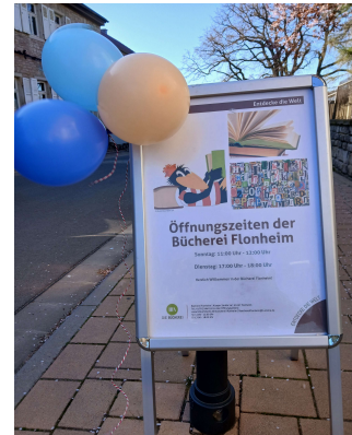
Nacht der Bibliotheken

Am 04. April 2025 nahm die Bücherei Flonheim an der Nacht der offenen Bibliotheken teil. Für die kleinen Nutzer*innen gab es ein Vorlesekinos mit Popcorn und Getränken. Die Erwachsenen waren herzlich zum Austausch bei einem kleinen Umtrunk und einem literarischem Rätsel eingeladen. Der Literaturquiz war eine Herausforderung für die Besucher*innen. Ein glückliche Teilnehmerin freute sich über einen kleinen Präsentkorb als Gewinn.