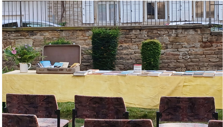
tolle Lesung im schönen Pfarrgarten

Zuhörer*innen mit teils humorvollen Stellen unter anderem aus Erich Kästers „Kleinem Grenzverkehr“ und „Bad Summer People“ von Emma Rosenblum der Abend verkürzt.