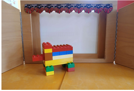
Elefant vor Kamishibai-Rahmen