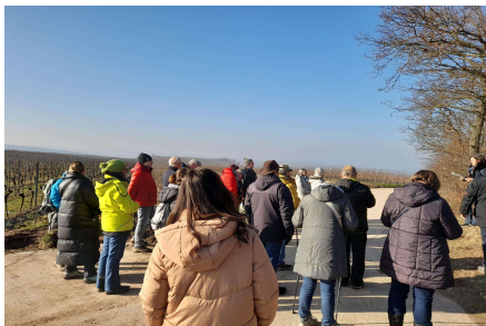
Wanderung bei schönstem Winterwetter

Am 19. Januar.2025 machten sich die Naturfreunde Flonheim auf zu einer Wanderung zu den schönsten Sehenswürdigkeiten der Ortsgemeinde. Begleitet wurde die