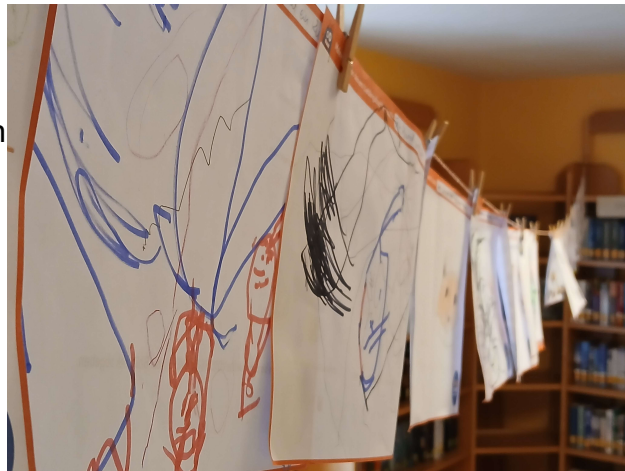
Selbstgemalte Bilder - Vorlesesommer

Auch in diesem Jahr hatten die kleinen Nutzer*innen Gelegenheit am Vorlesesommer teilzunehmen. Die Aktion wurde dieses Jahr von der Bücherei Flonheim organisiert und fand in der Zeit vom 29.Juni 2025 bis 24.August 2025 statt. Am 29.August 2025 fand die Abschlussveranstaltung mit der Übergabe kleiner Präsente sowie des Büchereipreises statt.