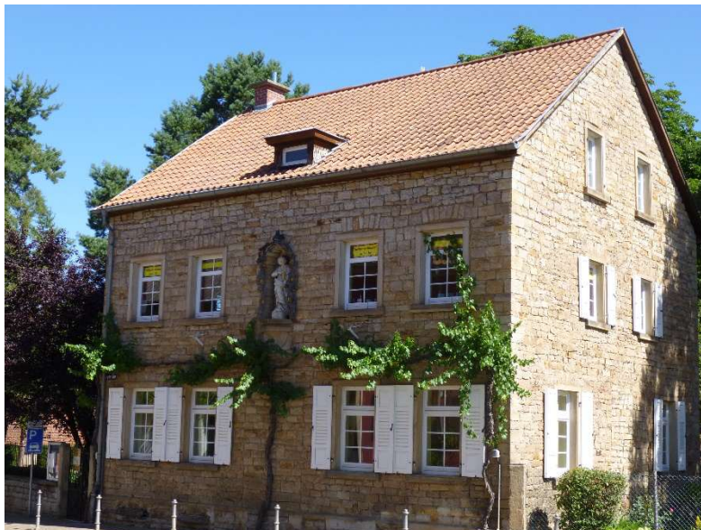
Pfarrhaus Flonheim *

Lesen macht glücklich, zufrieden und interessant!