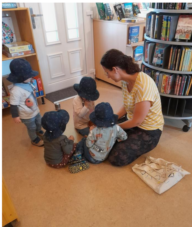
Die kleinen Gartenfeldmäuse

Ein einheitliches Präventionskonzept, speziell für die neue Pfarrei St. Lioba erarbeitet, ist im November 2024 in der Pastoralraumkonferenz verabschiedet worden. Aus den unterschiedlichen Gruppierungen, auch von den Büchereien, waren jeweils Vertreter*innen bei dessen Entwicklung beteiligt. Unser Team hat die nötigen gebotenen Präventionsschulungen absolviert.