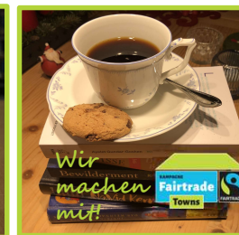
© KÖB Heppenheim: Vorlesen für Senior:innen – Die neuen Tonies sind da! – Buch & Kaffee (oder Tee)