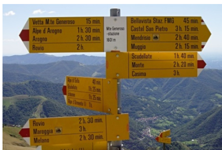
Orientierung und Ausblick

Zielgruppe: Interessierte, die den Jahreswechsel mit Gleichgesinnten in einer geistlichen Atmosphäre verbringen möchten.