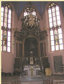
St. Rufus Gau-Odernheim