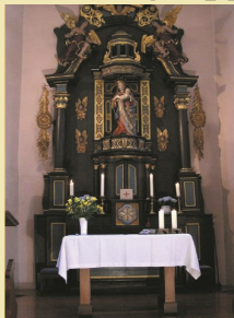
Maria Himmelfahrt Biebelnheim