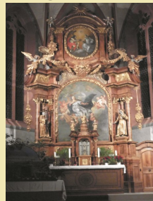
Maria Himmelfahrt & St. Christophorus Bechtolsheim

Versuchen wir, Weihnachten im wahren Geist des Evangeliums zu leben, indem wir Jesus in die Mitte unseres Lebens stellen. Papst Franziskus