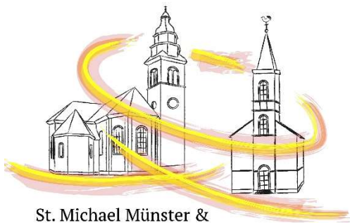
St. Michael Münster & St. Sebastian Eppertshausen