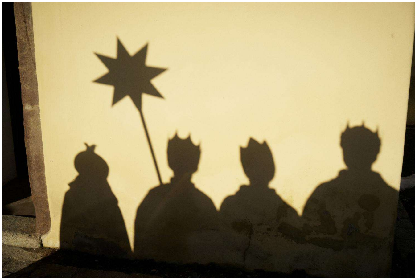
Bild: Benne Ochs, Kindermissionswerk in Pfarrbriefservice.de; Verfasser unbekannt

Geh mit Gott in die Welt, geh mit ihm in der Gewissheit, dass dein Lebensweg von ihm begleitet ist.