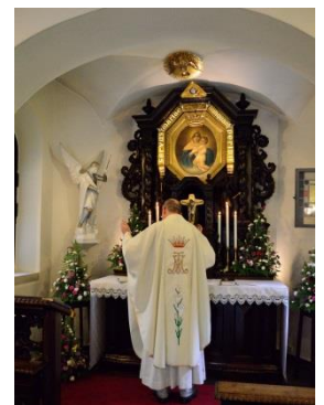
Wallfahrts - Gottesdienst