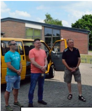
Abfahrt nach Vallendar