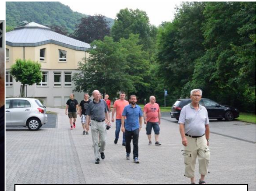
Ankunft in Vallendar