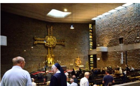
Gottesdienst vor der Rückfahrt in der Anbetungskirche