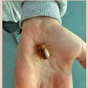
Im Frühling gibt es viel zu entdecken...