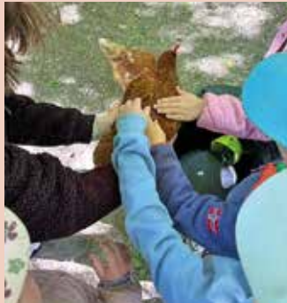
Die Hühner kommen ...