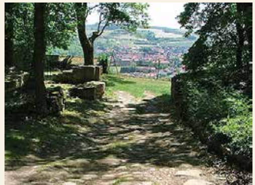
©Der Hildegard von Bingen Pilgerwanderweg Quelle: Stadt Bingen/Media

Begeben Sie sich auf den „Hildegard von Bingen-Pilgerwanderweg“ und wandern Sie auf den Spuren der Heiligen durch das Land der Hildegard, vorbei an verschiedenen Lebensstationen der berühmten Persönlichkeit des Mittelalters. Der 137 Kilometer lange Pilgerwanderweg beginnt