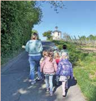
Die Osterkerze zieht in die Kapelle...