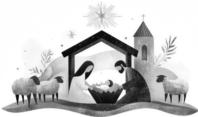
Markus Kreuzberger Gemeindereferent