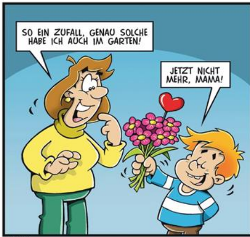
Grafik: Deike / image online

Liebe Gemeindemitglieder, bei Spenden geben Sie bitte unter „Verwendung“ den von Ihnen gewünschten Spendenzweck an. Spendenquittungen werden ab einem Betrag über € 300,00 ausgestellt., dafür geben Sie bitte Ihre Adresse bekannt. Spenden bis 300,00 € werden vom Finanzamt durch den Kontoauszug akzeptiert. Herzlichen Dank!