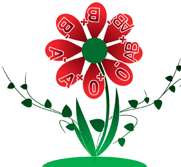
Graphik: „Blutspendeblyme Gerd Altmann pixabay.png“ (freier download)

https://www.unimedizin-mainz.de/transfusionszentrale