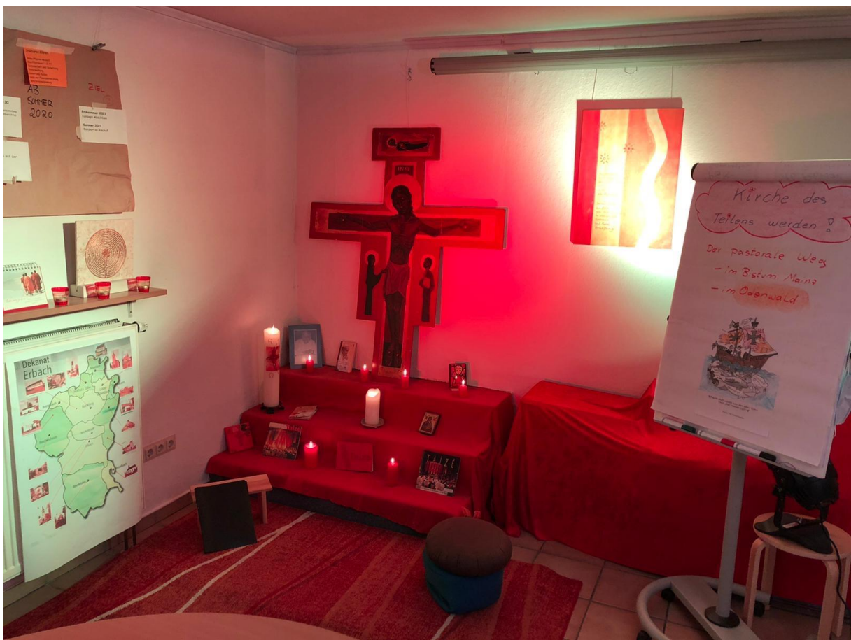
Thema: Auf dem (Pastoralen) Weg