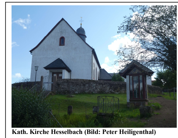
Kath. Kirche Hesselbach