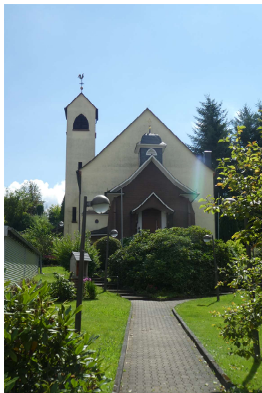
Kath. Kirche Beerfelden