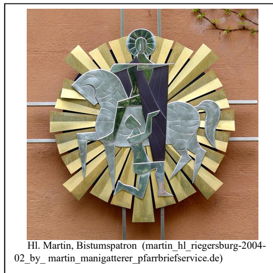
Hl. Martin, Bistumspatron