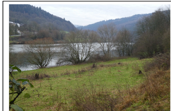
Der Neckar zwischen Hirschhorn und Neckarsteinach