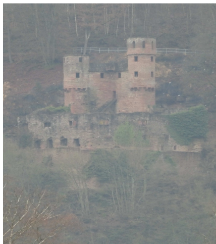
Burg Schwalbennest Neckarsteinach