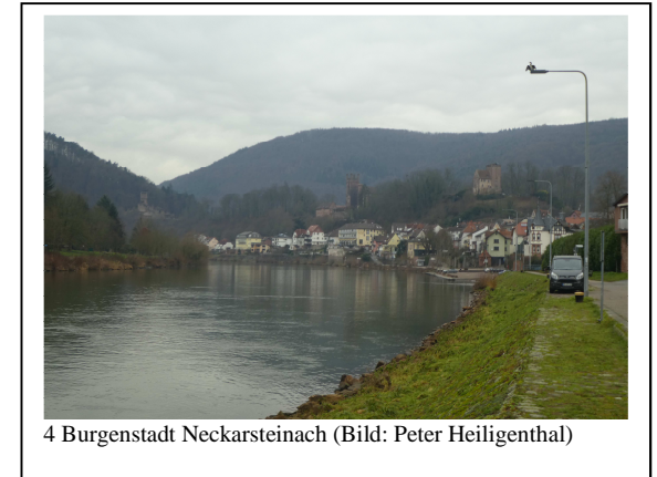
4 Burgenstadt Neckarsteinach