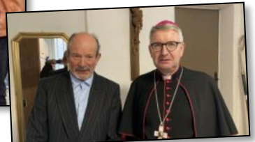
Impressionen von der Jubiläumsfeier