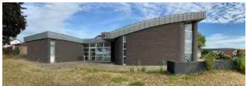
Maria Hilfe der Christen Landenhausen