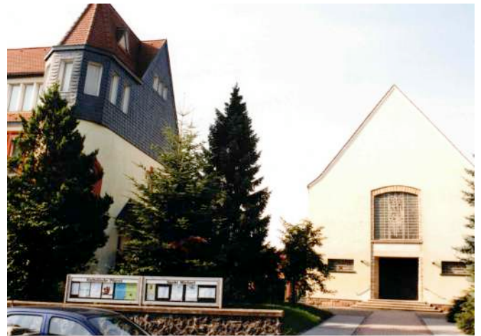
St. Michael Lauterbach