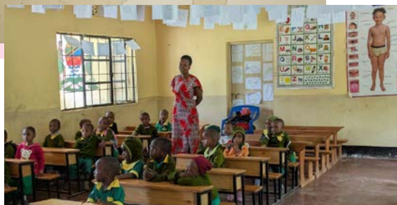
Oben: Kirche von St. Martin Links: Schulunterricht