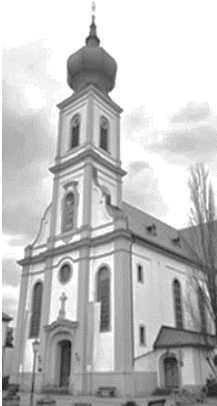
St. Maria Magdalena Magdalenenstraße 54 64579 Gernsheim