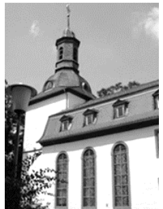
Hospitalkirche Philipphospital 122 64560 Riedstadt