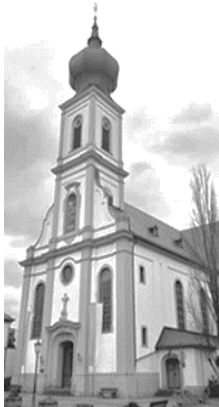
St. Maria Magdalena Magdalenenstraße 54 64579 Gernsheim