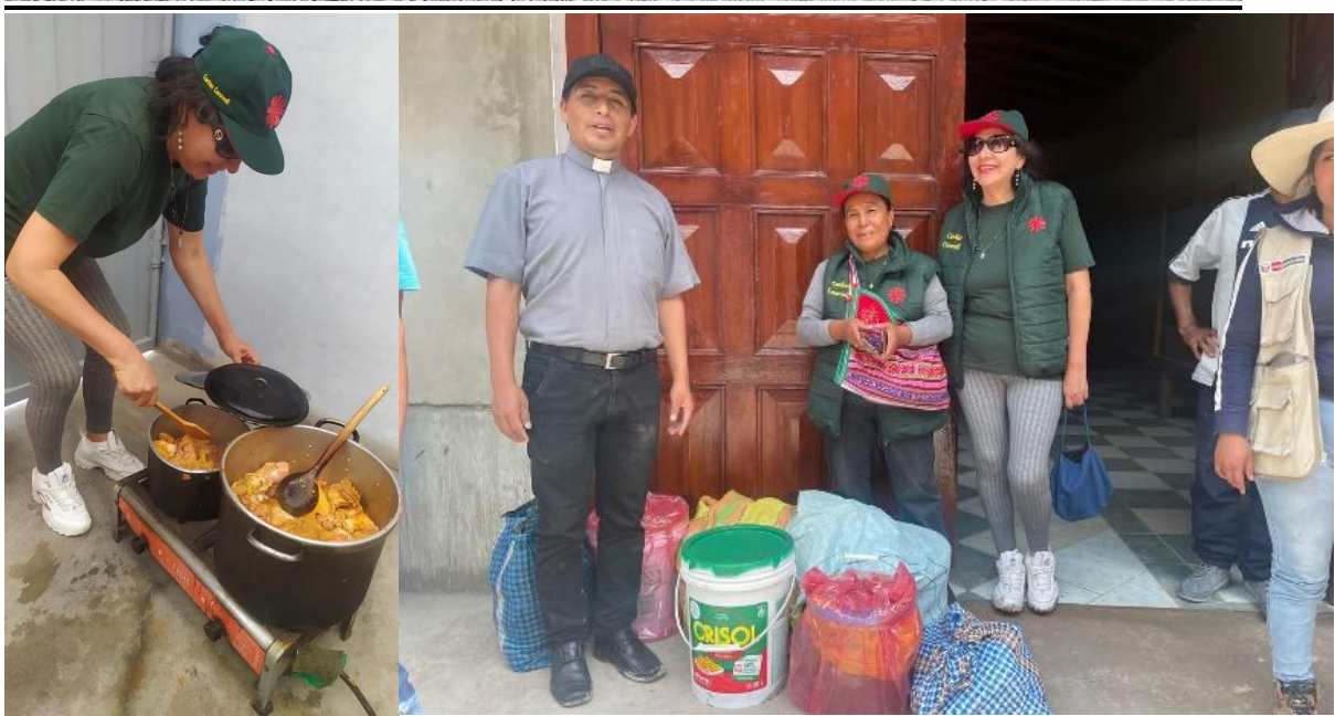
PAUZA –Notfallhilfe nach Erdbeerschh