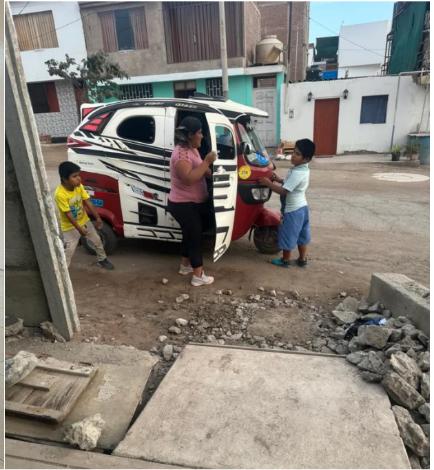
CHALA - Behindertenzentrum