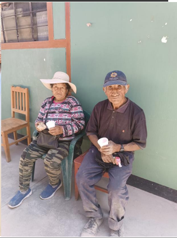
CARAVELI – Gesundheitscheck