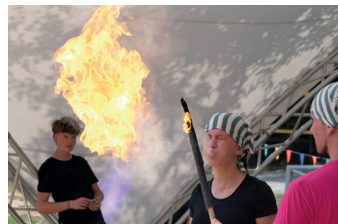
Zirkus Datterino

Der Sommerzirkus Datterino bietet Kindern und Jugendlichen in den hessischen Sommerferien ein einzigartiges Erlebnis auf dem Gelände des Forsthauses Fasanerie. In dieser Welt schlüpfen die Teilnehmenden in Rollen wie Trapezartistik, Clownerie oder Jonglage. Zirkuspädagog*innen und Ehrenamtliche leiten sie dabei an und bereiten gemeinsam die große Abschlussvorführung vor. Aktuell gibt es noch freie Plätze: