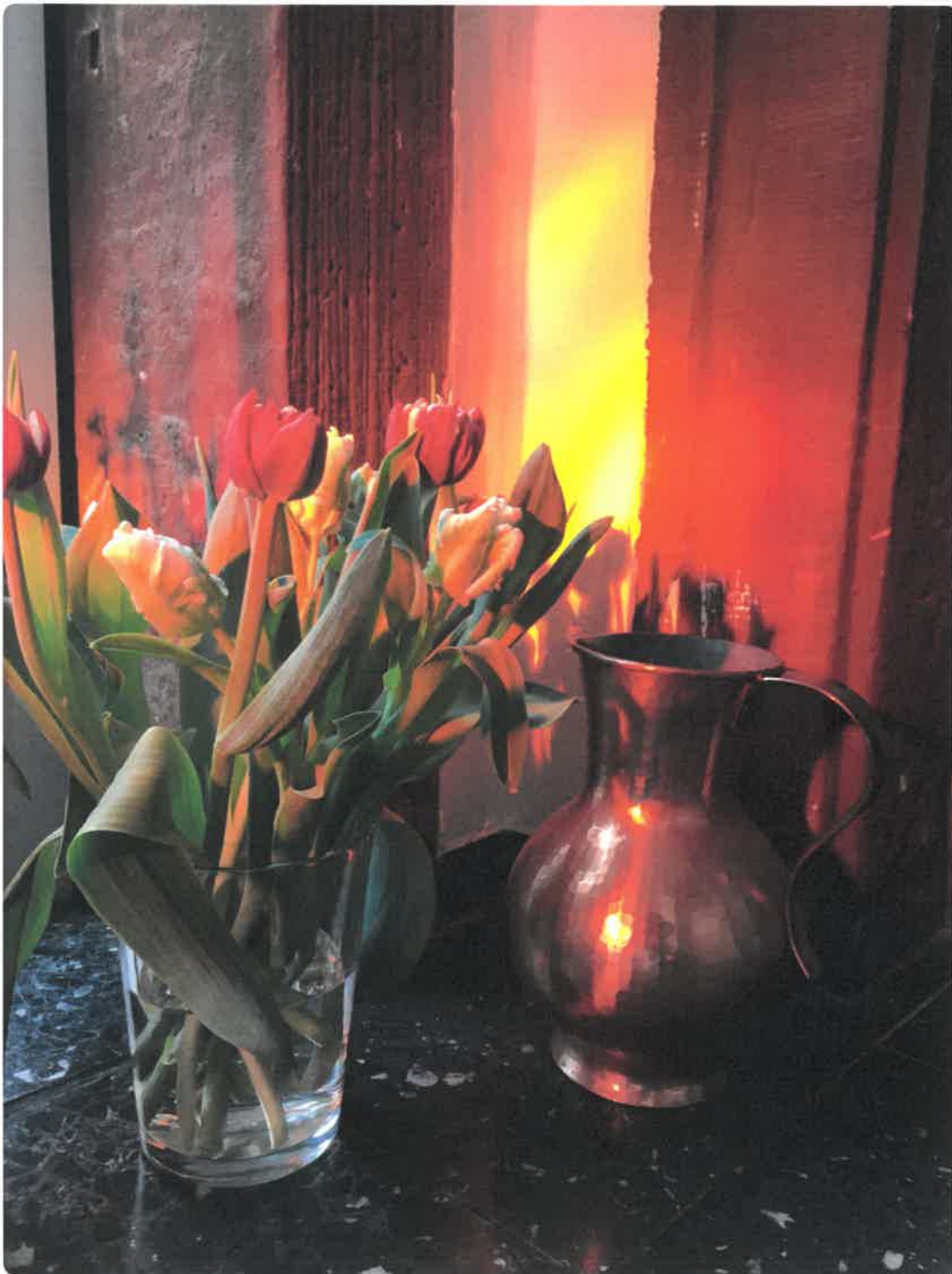
Abendlicht Eingang Pfarrhaus Campus St. Fidelis, Darmstadt