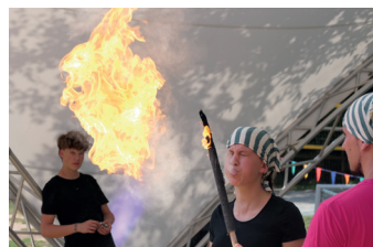
Zirkus Datterino

Der Sommerzirkus Datterino bietet Kindern und Jugendlichen in den hessischen Sommerferien ein einzigartiges Erlebnis auf dem Gelände des Forsthauses Fasanerie. In dieser Welt schlüpfen die Teilnehmenden in Rollen wie Trapezartistik, Clownerie oder Jonglage. Zirkuspädagog*innen und Ehrenamtliche leiten sie dabei an und bereiten gemeinsam die große Abschlussvorführung vor. Aktuell gibt es noch freie Plätze: