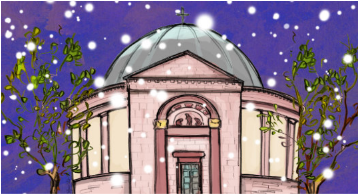
Illustration: Stefanie Kolb

Musikverein Darmstadt e.V. Chormusik am Staatstheater Darmstadt