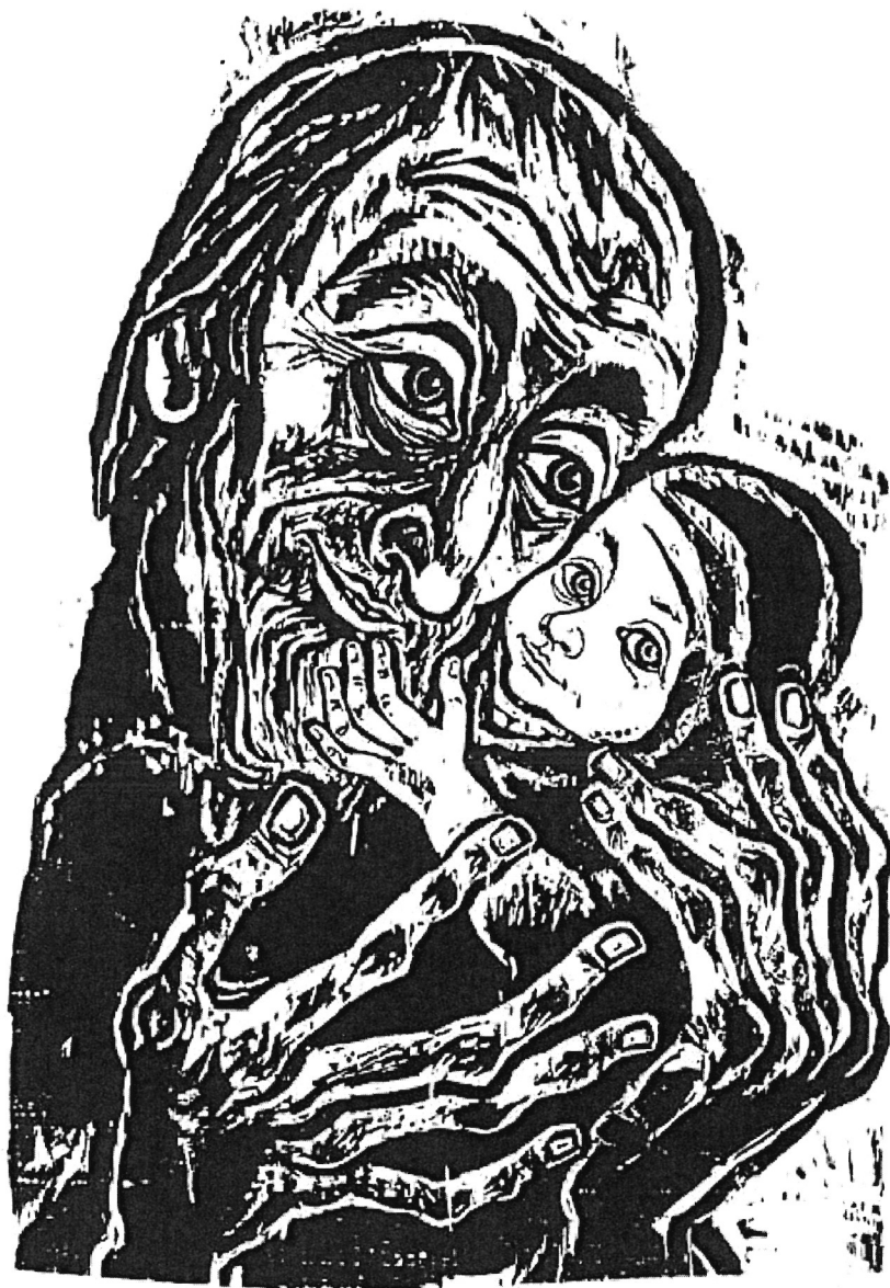
Holzschnitt von Walter Habdank (Simeon@1978 Kösel-Verlag)