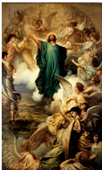
Gustave Doré, Public domain, via Wikimedia Commons