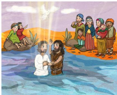
Grafik. Stefanie KolbImage 12/2025