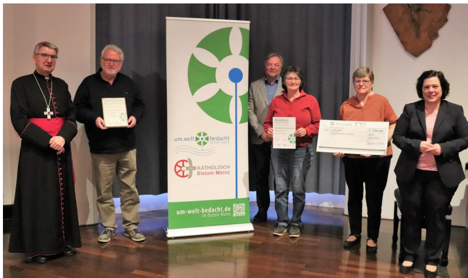
Die Übergabe des Sonderpreises Innovation an die Erbacher Delegation.