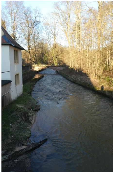
Brücke zum Park bei Schloss Fürstenuau