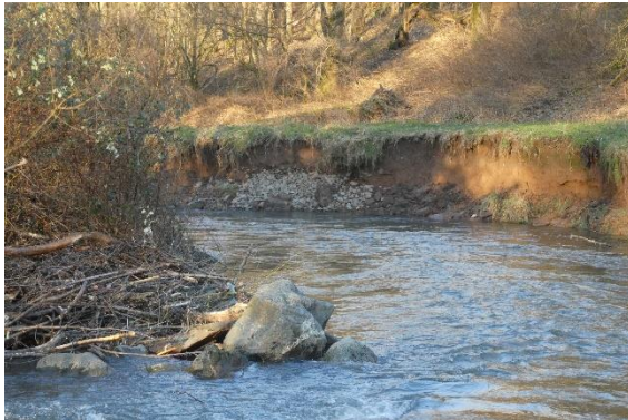
© Peter Heiligenthal Mümling bei Asselbrunn

Wem gehört die Erde, wenn nicht dir, Gott?