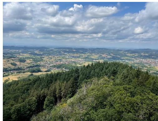
© Blick ins Weschnitztal vom Trommturm