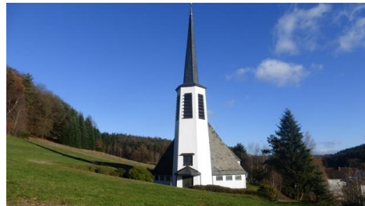
Kath. Kirche Hl. Dreifaltigkeit Kocherbach

Späteste Rückkehrzeit im Palais-Hof ist dann 15.30 Uhr.