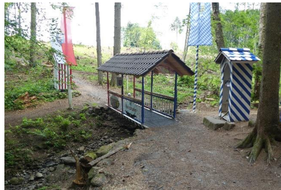
© Hessisch - Bayerische „Grenzanlage“ Würzburg - Boxbrunn