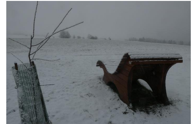
© Blick auf Beerfelden im Schnee 2. Januar 2025