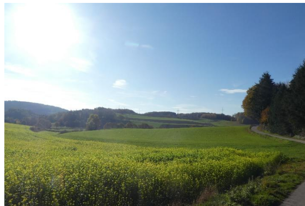
© Rapsfeld bei Rothenberg im Sommerlicht