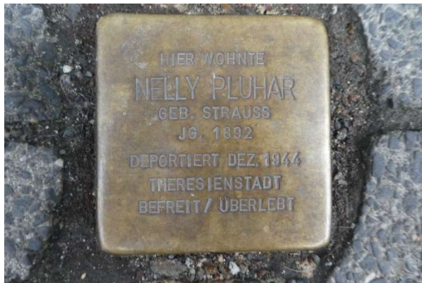
Stolperstein in Michelstadt

Nach der Wanderung werden wir in einer Gaststätte einkehren. Späteste Rückkehr in den Palais-Hof ist dann 15.30 Uhr.