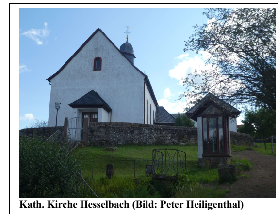
Kath. Kirche Hesselbach