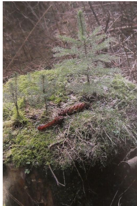
Bemooster Baumstumpf mit junger Fichte