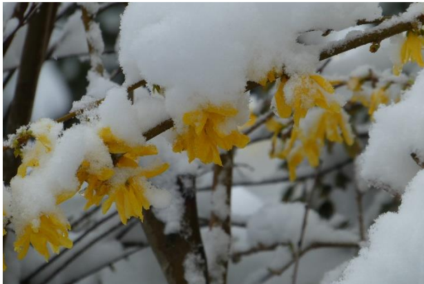
Forsythie im Schnee