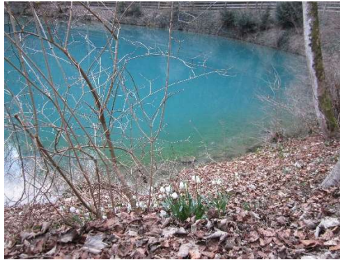
Blautopf - Die Farbe Türkis

Die Farbe Türkis steht für Wahrheit, Klarheit, Erfahrung und Erkenntnis. Diese Farbe findet man in den Farben der Eisberge und des Gletschereises. Daher wird Türkis als die kälteste aller Farben empfunden. Mit dieser Farbe verbindet man Beharrlichkeit und Stehvermögen, sowie konzentrierte Spannung. Sie symbolisiert aber auch Unabhängigkeit, Eigenständigkeit, Gelassenheit und Ehrlichkeit.