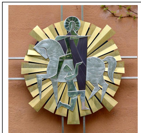
Hl. Martin, Bistumspatron