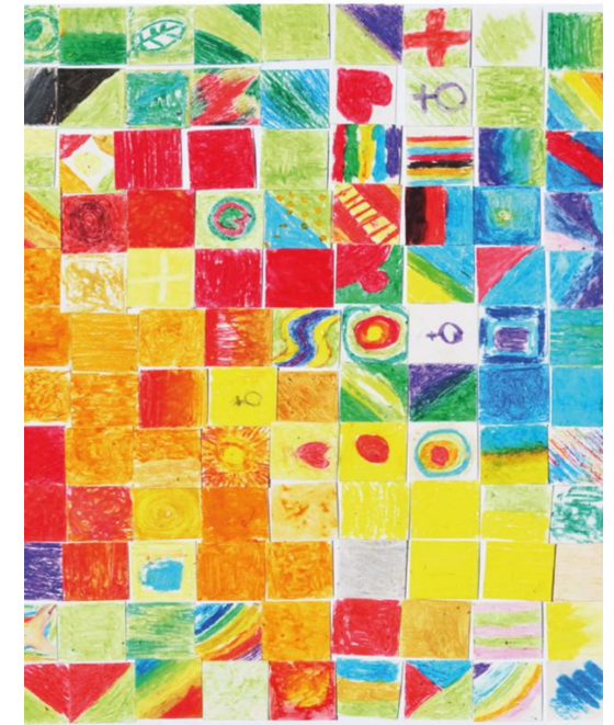
Dieses Bild ging hervor aus der Aktion „Meine Farbe für den Pastoralen Weg“ beim Workshop - Tag zum Pastoralen Weg am 1. Juni 2019 in Mainz.