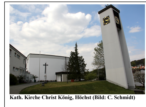
Kath. Kirche Christ König, Höchst