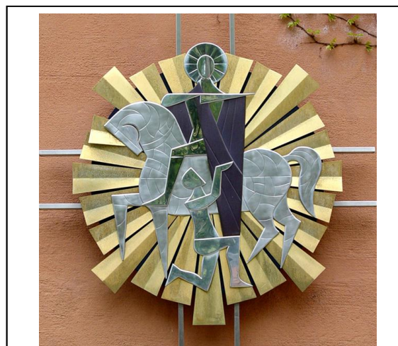
Hl. Martin, Bistumspatron