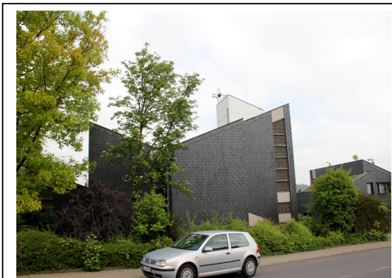
Kath. Kirche St. Maria Verkündigung Reichelsheim