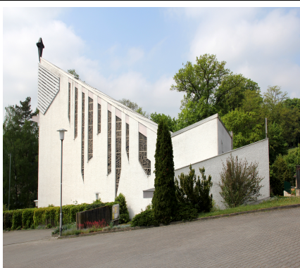
Katholische Kirche St. Laurentius Fränkisch-Crumbach