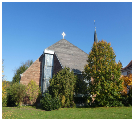
Katholische Kirche St. Margareta Seckmauern