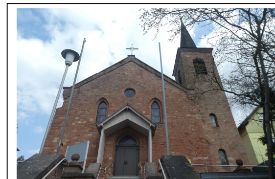
Kath. Kirche St. Bonifatius Lützelbach