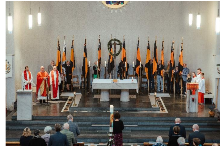
Festgottesdienst zum 70jährigen Jubiläum