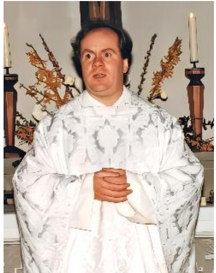
Bei einer Wallfahrt der Büttelborner Pfarrei nach Flüeli zum heiligen Bruder Klaus.

Weitere Schwerpunkte setzte Pfarrer Berbner bei Krankenbesuchen, der Ökumene vor Ort, den Vorbereitungen zur Erstkommunion und Firmung, Sakramen-