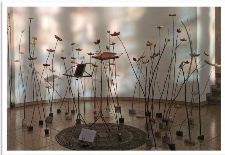
„Gedankenschiffchen“ von der Künstlerin Angelika Nette „Alle Menschen werden Brüder...“

Gottesdienste | Informationen | Veranstaltungen